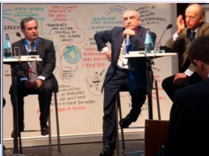
本照片係由本會攝於哥本哈根場邊企業日現場