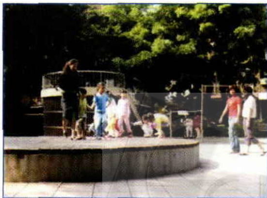
图2 在参与式设计后，台北市永康公园以小区舞台取代原本的蒋介石铜像

另一方面，台湾的民间社会也开始建立起“适居城市”的指标。在台湾创刊20多年，具有高度社会公信力的《天下》杂志工作团队，从2004年开始结合统计数字及民调，进行台湾25县市的“幸福城市”评比。指标包括未来潜力、人民富足、年轻活力、妇女友善、生活安全、环境美感、老年赡养、财务稳健等八大项目及之下的数十项指标。2004年的排名前5名依序是台北市、新竹市、台中市、桃园县及澎湖县。调查发现各县市的幸福来源各有不同，但不幸福感的主要来源是治安及失业带来的经济社会问题。台湾的乡村则普遍面临人口外流与老化引起的社会危机。当年，台北市除了高居幸福城市榜首外，同时被选为“最有