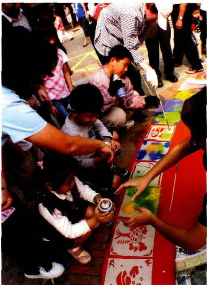
台北大理街小区举办小区营造活动邀请